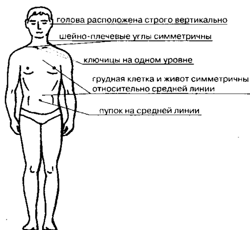
А — вид спереди

Педагог дает задание учащемуся встать ровно. Далее он анализирует положение позвоночного столба ребенка спереди, сзади, сбоку . При осмотре спереди у человека, имеющего правильную осанку, определяется строго вертикальное положение головы: подбородок слегка приподнят, линия надплечий горизонтальна; углы, образованные боковой поверхности шеи и надплечьем, симметричны; грудная клетка не имеет западений или выпячиваний; живот также симметричен; пупок находится на средней линии.